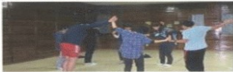
▲ 무용 테라피 장면

무용 동작 치료는 신체 움직임을 사용하여 개인의 신체, 정서, 인지, 사회적 통합하는 심리 치료의 한 분야이다.